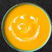
Mango Cocos-Soße Mango coconut sauce

serviert mit Soße nach Wahl: served with sauce of your choice: