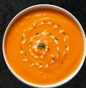
Curry Cocos-Soße Curry coconut sauce