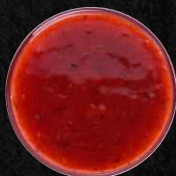
Pikante Soße Spicy sauce