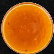
Zitronengras, scharf Soße Lemon grass spicy sauce