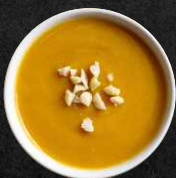
Erdnuss Cocos-Soße Peanut coconut sauce