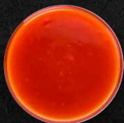
Süßsauer Soße Sweet and sour sauce